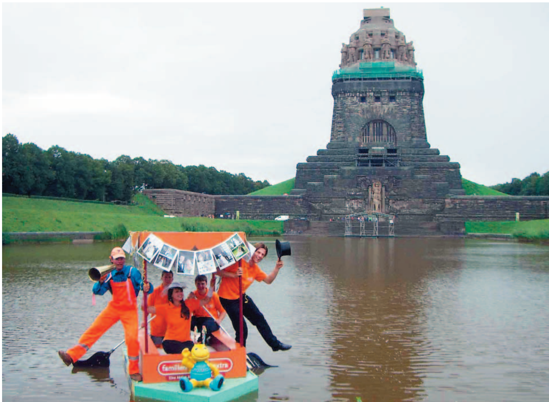
Gut drauf auch ohne leistungssteigernde Mittel: das Stadtwerke-Team und Moderator Paul Fröhlich (l.) beim Test des „Familien Extra Mobil“ vor dem Denkmal.

Ⓜ Anmeldungen fürs Badewannenrennen am 2. September sind noch bis 31. August möglich auf www.nato-leipzig.de/badewannenrennen/regeln.html (als Anmelde.pdf).